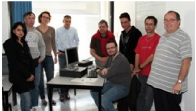
Groupe de stagiaires de la formation Pôle support informatique