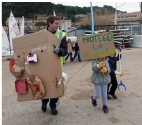
Mini-projet Nettoyage de plage

Le mercredi 27 mars 2013, un groupe de stagiaires a organisé une opération de sensibilisation au tri sélectif et proposé dans ce cadre une demi-journée de nettoyage de la plage de Carry-le-Rouet.