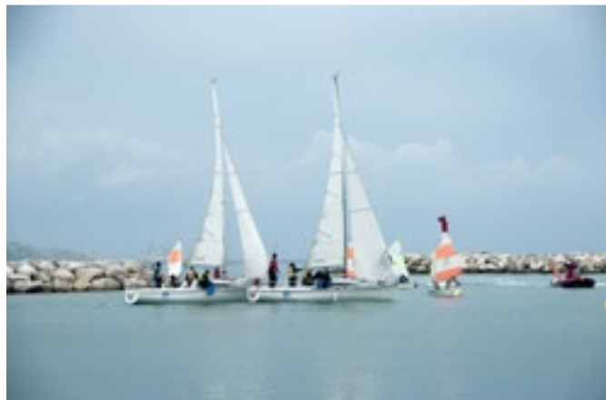
Mini-projet Voil'à DD

a participé à son ancrage territorial et devrait être reconduite en 2014.