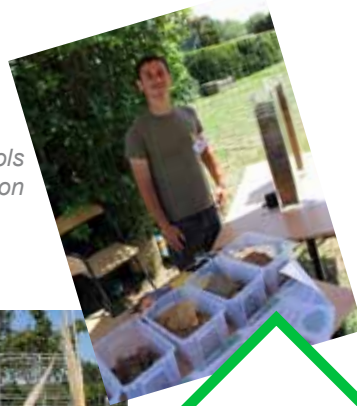
Présentation des sols de la région