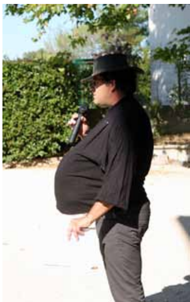
L'ambassadeur de «L'enveloppement durable»