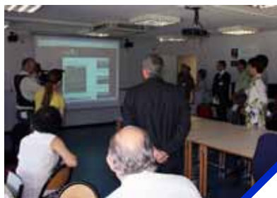
PFE «Fontaines et portes remarquables» en partenariat avec l'office du tourisme d'Aix en Provence