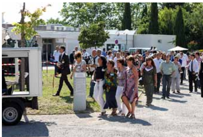
Poursuite de la parade

Ecole Nationale des Techniciens de Équipement, établissement d'Aix en Provence 680, Rue Albert Einstein - CS 70508 - 13593 Aix en Provence Cedex 3 Tel. : 04.42.37.20.00 - E-mail : ente-aix@developpement-durable.gouv.fr Site web : http://www.developpement-durable.gouv.fr