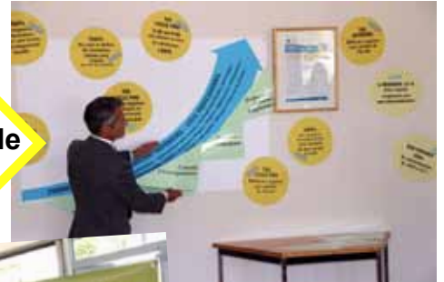
La qualité, une démarche en perpétuel mouvement d'amélioration.