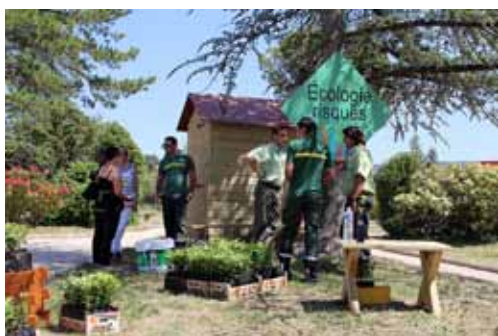
Petit arbre deviendra grand

Pour compenser les déplacements dus à cet évènement, une équipe de stagiaires a évalué le bilan carbone de la journée. Afin de compenser l'impact de la célébration des 40 ans, chaque invité s'est vu remettre un bébé chêne, à planter dans son jardin. Les petits chênes non adoptés ont été plantés par les soins de l'ONF, dans une forêt publique.