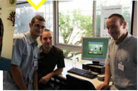
PFE multimédia «Marchés publics»