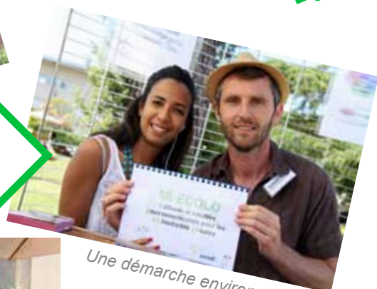
Une démarche environnementale pour les collectivités