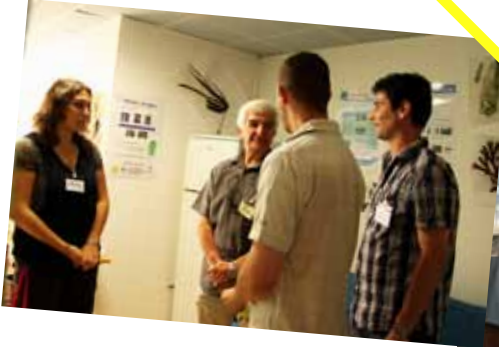
PFE multimédia «Wikhydro»