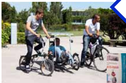
Des vélos de toutes sortes