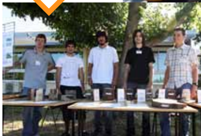
De l'arbre à la maison