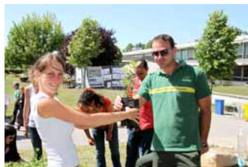
Compensation carbone : un chêne pubescent

500 arbres ont ainsi été distribués. En grandissant, ils compenseront rapidement le carbone émis par les déplacements des participants.