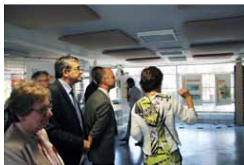
Présentation de l'établissement