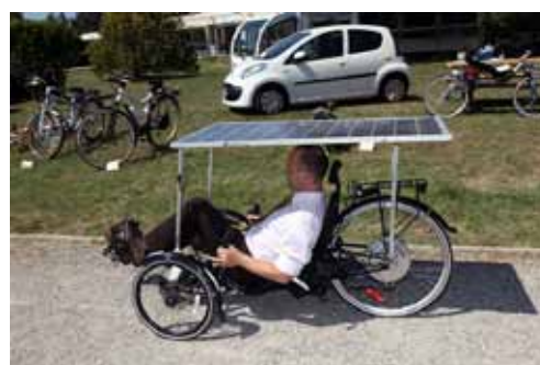
Essai du tricycle solaire prêté par l'IUT Saint-Jérôme