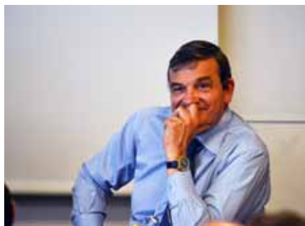
Alain Vallet, Chef du SPES, Ministère de l'Écologie