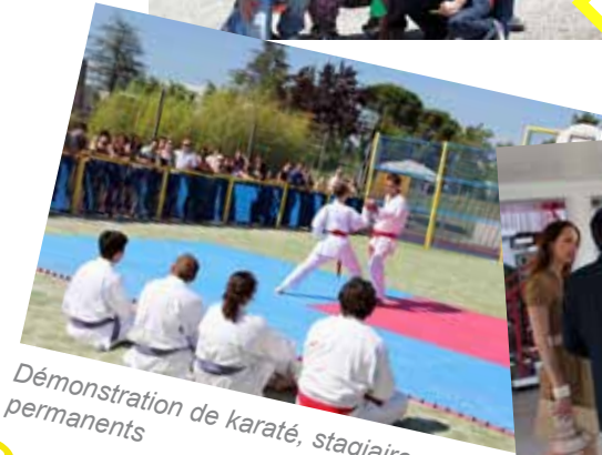
Démonstration de karaté, stagiaires et permanents