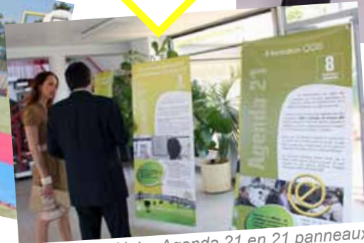
Notre Agenda 21 en 21 panneaux