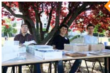
Matériaux de construction isolants