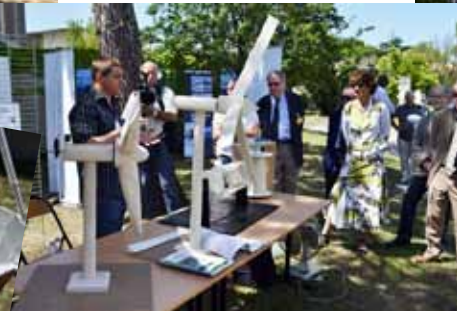
Bon vent aux éoliennes