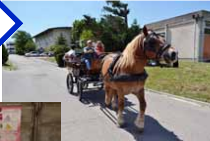
Le retour du cheval