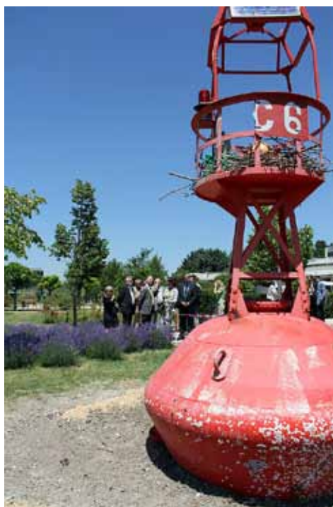
Inauguration de la balise maritime

Point d'orgue, la rencontre avec l'ambassadeur de «l'enveloppement durable» qui a parodié nos mauvaises habitudes... avant une collation amicale pour clore la journée.