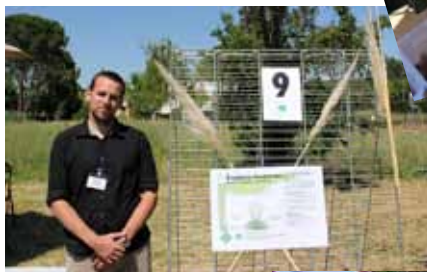
Comment lutter contre les plantes invasives