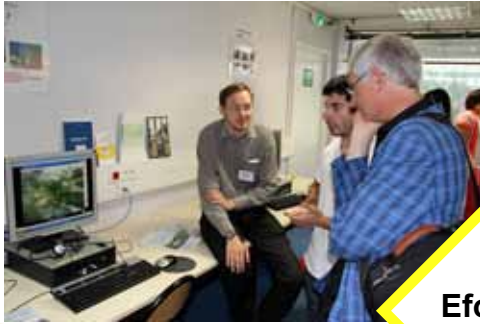
PFE multimédia «Eco-quartiers»