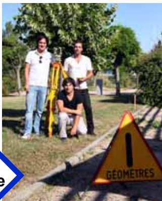
Techniciens et géomètres ?