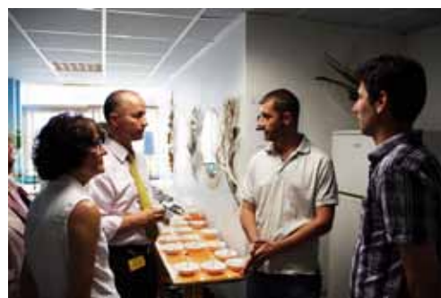
Projet wikhydro- stand dégustation algues