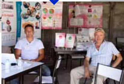
L'éco-conduite : en mode ECO !