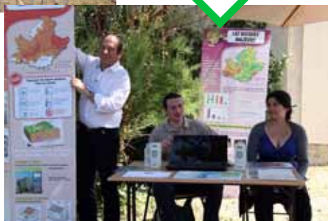
A l'abri sur le stand des risques